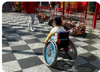
【さんりんしゃひろば】

三輪車でもスイスイ走れるほど、 平坦 です。車椅子に乗りたいたっていただけのお子さんもいました。