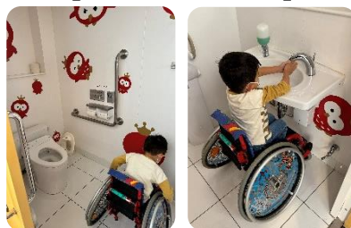
【イケこどもトイレ】

手洗い台は低く設定 されています。ユニバーサルデザインを採用し、利用者全員が使用します。