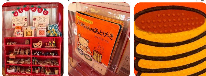
【キッズハウス（インクルーシブなえほんコーナー）】

点字の絵本や触って遊べる迷路で、視覚障害の有無にかかわらず、誰もが一緒に楽しむことができます。